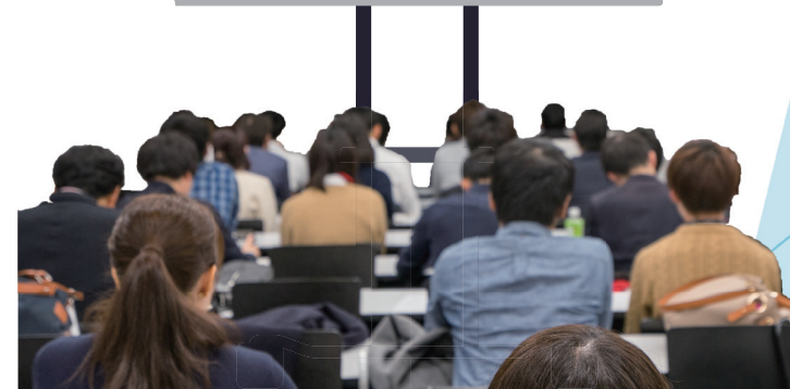
Branch 校 [青沼英語塾〇〇教室 (校)]